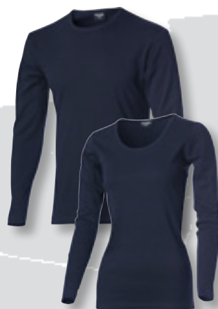
2260 marin *