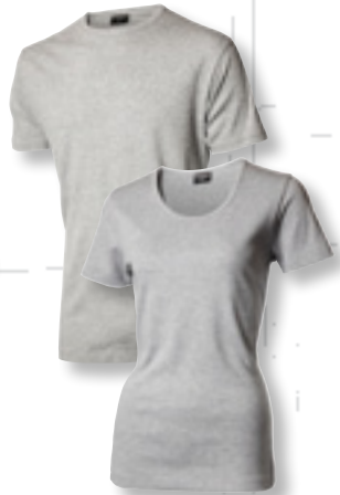
7250 gråmelerad *