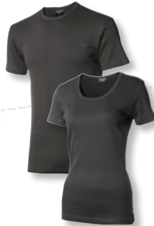
7270 antracit *