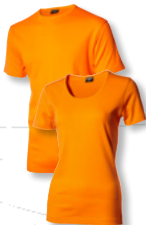
6290 orange *