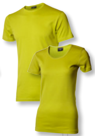
3240 lime *