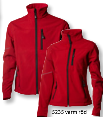
5235 varm röd