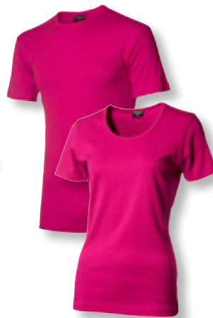
5230 rosa *