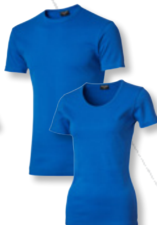
2250 azur *