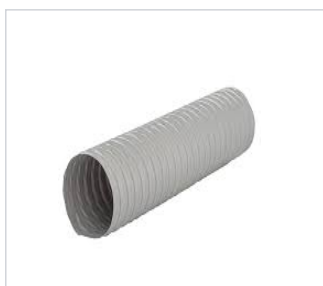
art.nr: 20616 Slangpaket EvoDry 12/18/24