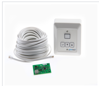
art.nr: 20617 Uppgraderingskitt till EvoDry H