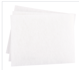
art.nr: 20510 Filter EvoDry 12 3-pack