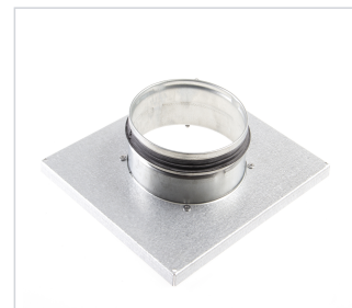
art.nr: 20614 Processluftstos EvoDry 12 1x125 mm