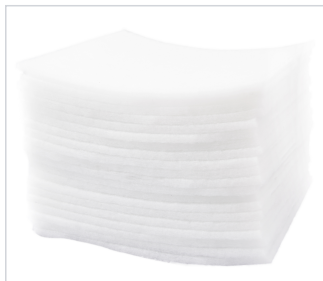
art.nr: 20511 Filter EvoDry 12 20-pack