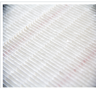
art.nr: 380044 Filter A50S ePM1 55%