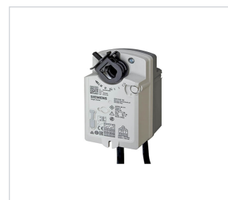
art.nr: 340098 Spjällmotor Fjäder 230V GPC321.1A