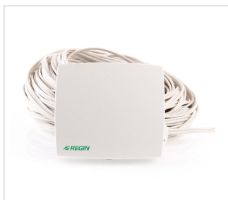
art.nr: 399087 Fuktstyrning A-serien