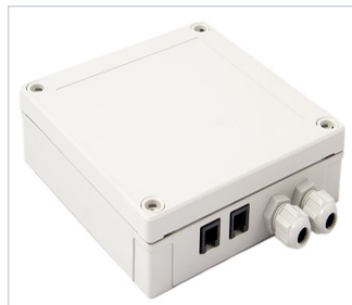
art.nr: 399088 ModBus-enhet