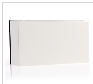
art.nr: 399174 Tempgivare EvoControl & AVC-02 rum