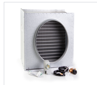
art.nr: 399106 Vattenbatterisats A50S/A70T Värme