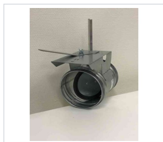
art.nr: 380136 Spjäll 125 Typ 4 m. motorhylla