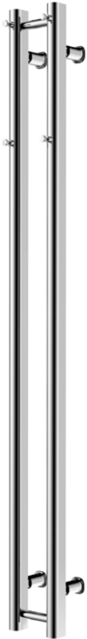
2-rör, krom 120 x 1 400 mm (b x h) Effekt: 148 W Art nr 876 05 28

Alterna Calore handdukstork i förkromat eller matt svart stål. För elpatron och/eller värmesystem. Med vertikala D-rör om 2 respektive 4 stolpar. Levereras med 4 väggfästen, 2 proppar samt en luftningsventil.