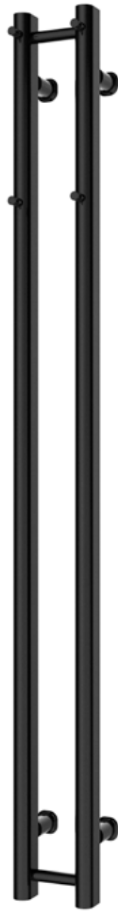
2-rör, matt svart 120 x 1 400 mm (b x h) Effekt: 187 W Art nr 873 02 47