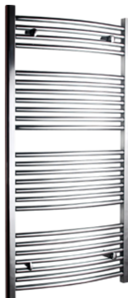
Svängd modell, rund design, förkromad

600 x 1 200 mm (b x h) Effekt: 445 W Art nr 876 00 14