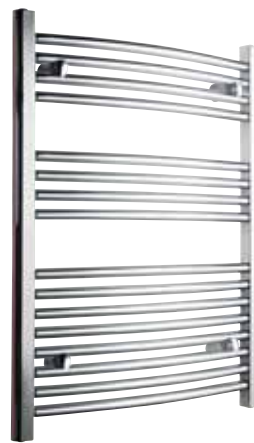
Svängd modell, rund design, förkromad

500 x 800 mm (b x h) Effekt: 246 W Art nr 876 00 13