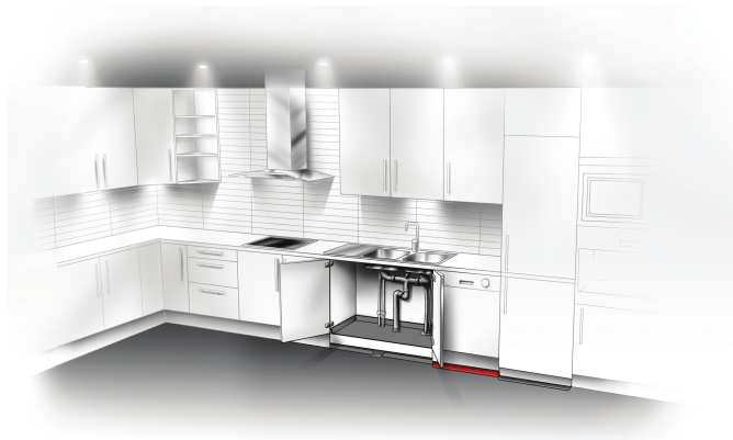
Vattensäkert kök: Diskmaskinsunderlägget placeras knappt synligt kant i kant med diskmaskinens sockel.