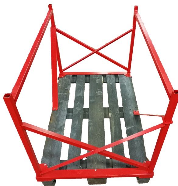
Ny ihopfällbar design på emballaget